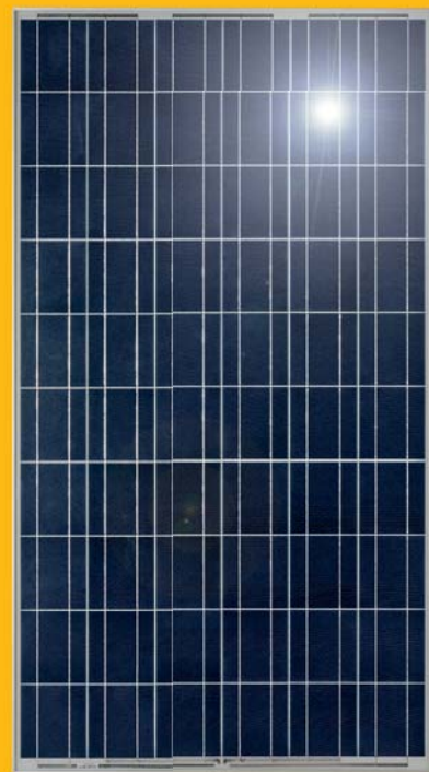
Polykristallines Modul (Detailansicht)