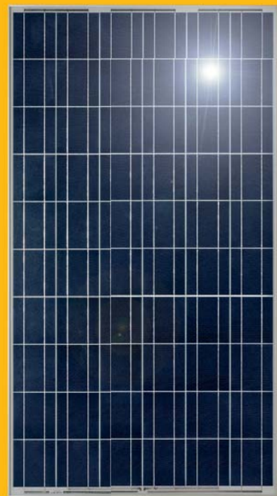
Polykristallines Modul (Detailansicht)