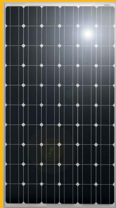
Monokristallines Modul (Detailansicht)