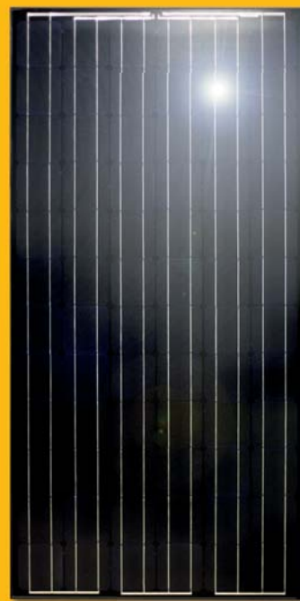
Monokristallines Modul (Detailansicht)