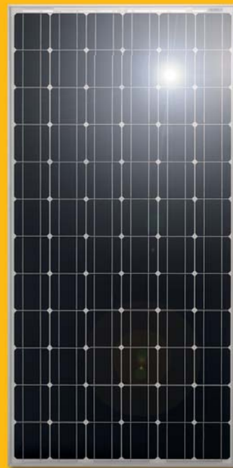
Monokristallines Modul (Detailansicht)